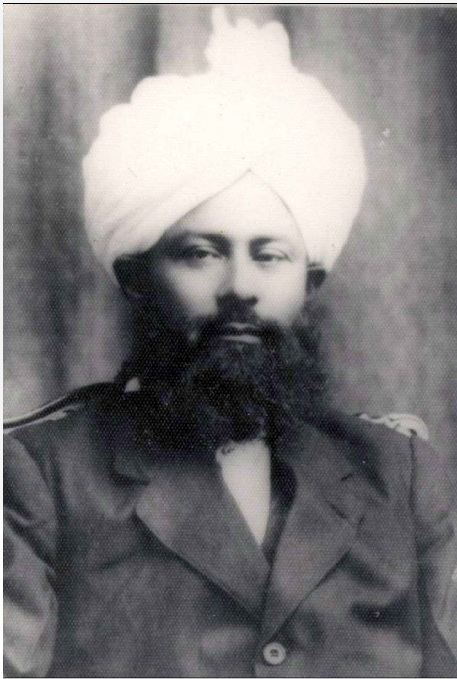
Billede: Hans Hellighed Mirza Bashir-uddin Mahmood Ahmad

Ahmadiyya Menighed i 1914-1965. Blandt hans intellektuelle bedrifter er en omfattende mængde litteratur, som indbefatter både taler og skrevne bøger. Ifølge en profeti af hans far ville han vokse op til at blive en spirituel reformator med særlige kvaliteter (deraf titlen Den Lovede Reformator).